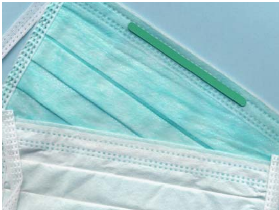
OP-Masken und Abdecktücher

Die Produktionsanlagen für die verschiedensten Nonwovens-Produkte werden von uns projektiert und für alle Anwendungsbereich schlüsselfertig angeboten. Dabei spielt es keine Rolle, ob es sich um Heimtextilien oder technische Anwendungen handelt. Einsatzbereiche sind z. B. Bodenbeläge, Automobilauskleidungen, Geotextilien, Filtermedien, Vlieskunstleder oder Naturfaserfilze. Ebenso werden Anlagen zur Herstellung von Disposables für Anwendungen in Kosmetik, Medizin und Hygiene angeboten