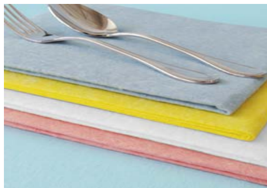
Wischtücher für Haushalt und Industrie