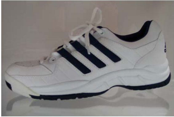
Sportschuh aus Vlieskunstleder