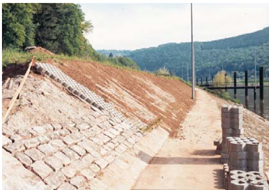
Uferbefestigung mit Geotextil

Für die DiloGroup hat die Teilnahme an der Index Tradition. Auf einem über 100 m 2 großen Stand werden die Firmen der DiloGroup - DiloTemaafa, DiloSpinnbau und DiloMachines - umfassend anhand von diversen Produktbeispielen über die vielfältigen Anwendungsbereiche von Nonwovens informieren. Natürlich stehen Ihnen unsere Fachleute auch gerne für technische und technologische Diskussionen zur Verfügung.