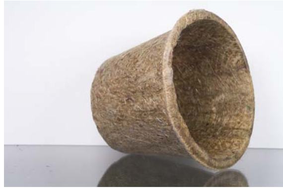
Pflanztopf aus Naturfasern

Die Produktionsanlagen für die verschiedensten Nonwovens-Produkte werden von uns projektiert und für alle Anwendungsbereich schlüsselfertig angeboten. Dabei spielt es keine Rolle, ob es sich um Heimtextilien oder technische Anwendungen handelt. Einsatzbereiche sind z. B. Bodenbeläge, Automobilauskleidungen, Geotextilien, Filtermedien, Vlieskunstleder oder Naturfaserfilze. Ebenso werden Anlagen zur Herstellung von Disposables für Anwendungen in Kosmetik, Medizin und Hygiene angeboten